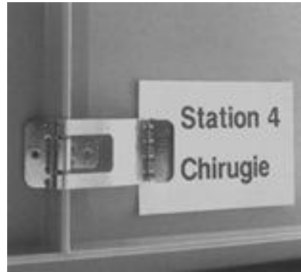
1280-985 (Edelstahl) 1236-0017 (verzinkt)