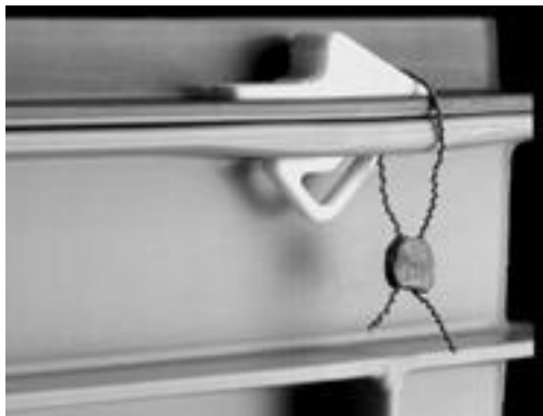
System A Plombierbare Schnappverschlüsse und Bohrung für Sicherheitsschloss Art.- Nr.: 1236-vh

Zwei Schließ-Systeme stehen zur Auswahl. (Bitte geben Sie bei der Bestellung den gewünschten Bestellnummer Zusatz mit an)