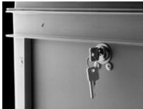
System SG Gleichschließendes Sicherheitsschloß für einen oder mehrere Behälter. Art.-Nr.: 1236-sg