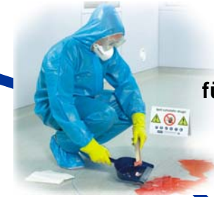
SpillKits für den Notfall