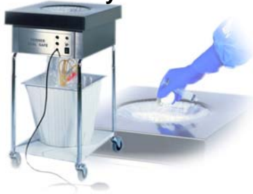
Entsorgungssysteme für Zytostatika